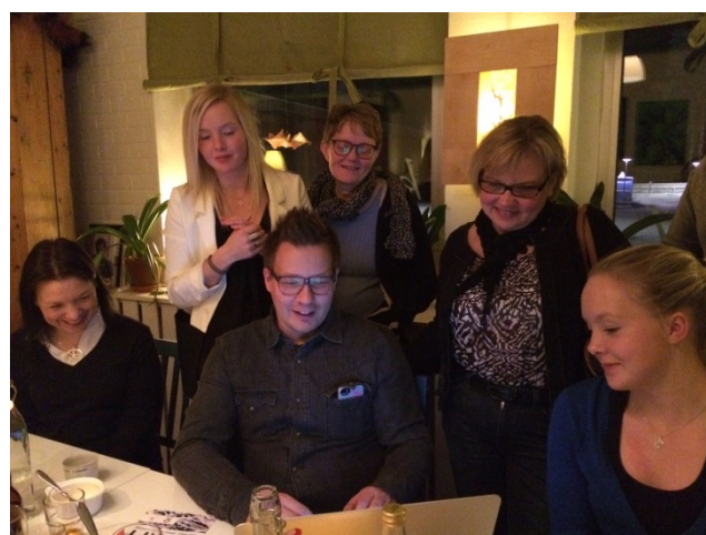
Förhandsvisning av Gurpifilmen