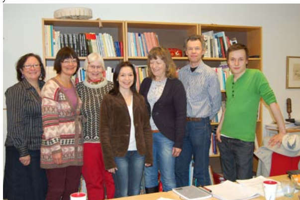
Deltagare vid referensgruppsmötet i Umeå.

SSR har tillsatt en referensgrupp för sameföreningarna, sex representanter möttes på kansliet i Umeå lördag den 22 januari.