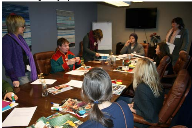
Workshop i Vilhelmina.

Projektet Indigee - Indigenous Entrepreneurship har haft sin första konferens. Ett femtiotal deltagare från Ryssland, Norge, Finland och Sverige deltog i workshops, föreläsningar, individuella rådgivningar och nätverkande under tre dagar i Vilhelmina (25-27/11). Deltagarna åkte hem fulla av nya idéer, inspiration och nya kontakter. Den svenska delen av projektet har nu fullt antal deltagare (20 st). Fortfarande finns några platser för norska och finska deltagare i projektet.