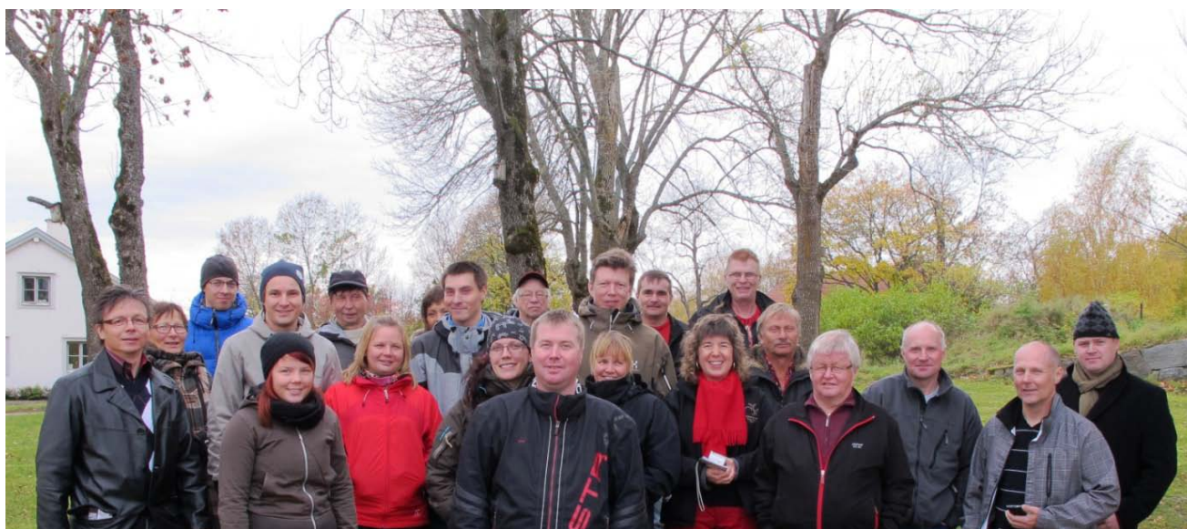
Deltagare vid studieresa arrangerad av Renlycka och meNY oktober 2010.